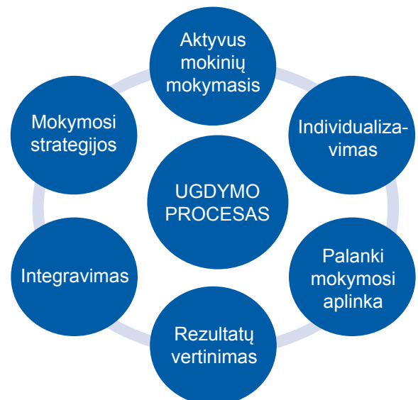
1 pav. Svarbiausi ugdymo proceso ypatumai