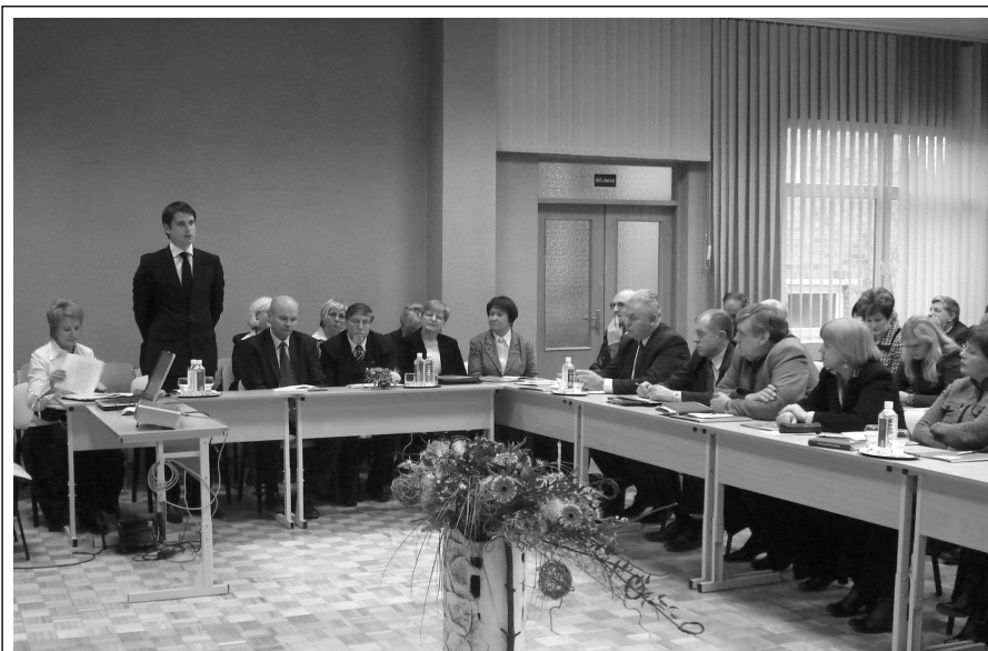
Akredituotų gimnazijų forumas dirbo konstruktyviai