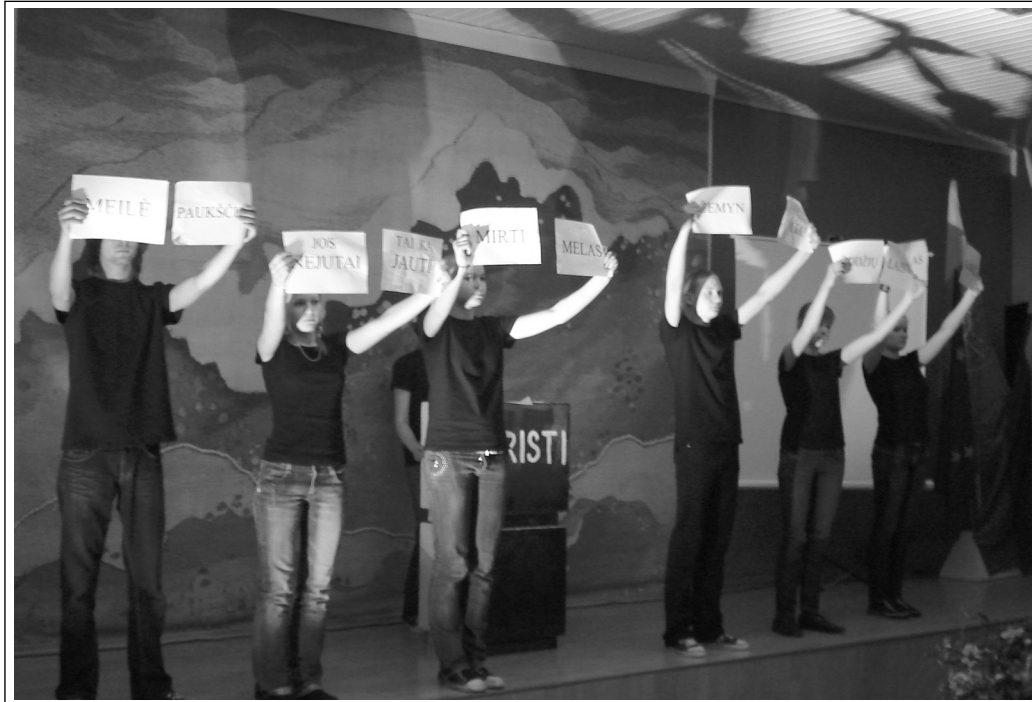
Konferencijos darbą pajvairino gimnazistų meniniai pasirodymai

Klaipėdos „Žaliakalnio“ g-jos direktorius