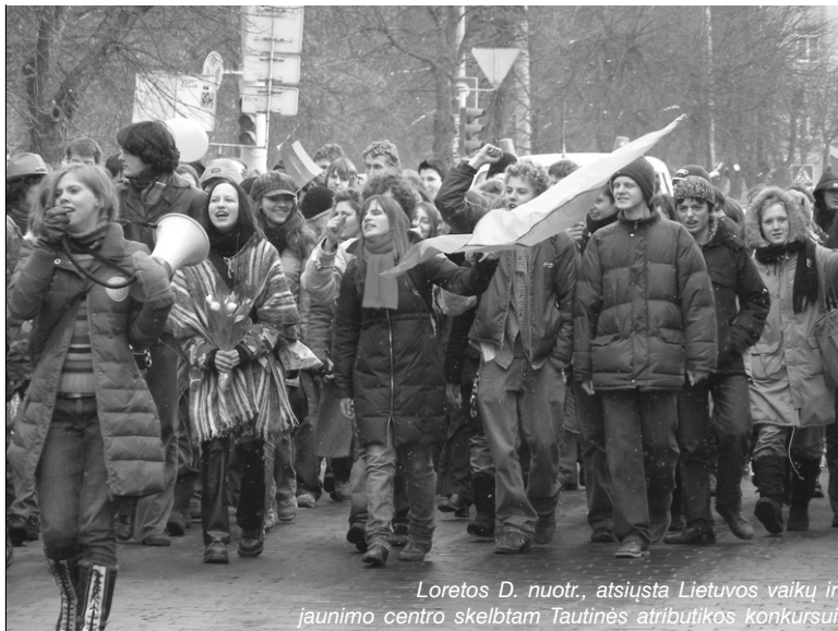
Loretos D. nuotr., atsiųsta Lietuvos vaikų ir jaunimo centro skelbtam Tautinės atributikos konkursui.

Bendradarbiavimo svarba mokant gyvenamosios vietovės istorijos